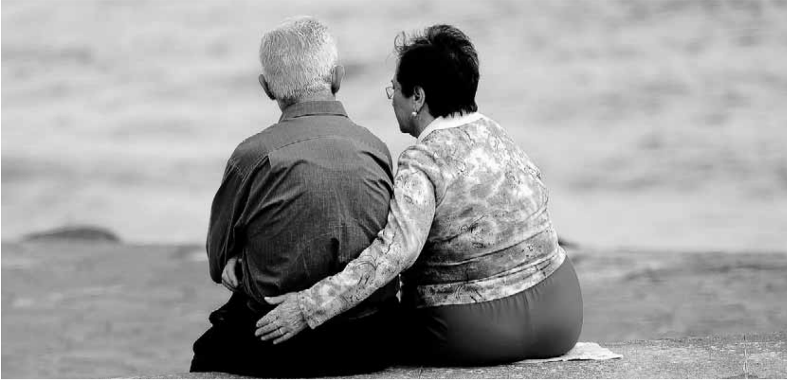
Senioren am Strand: Je näher das Ende des Berufslebens rückt, desto wichtiger ist es, das Vermögen zu schützen.